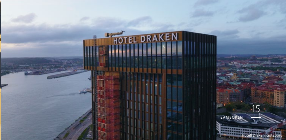
Hotel Draken, Göteborg