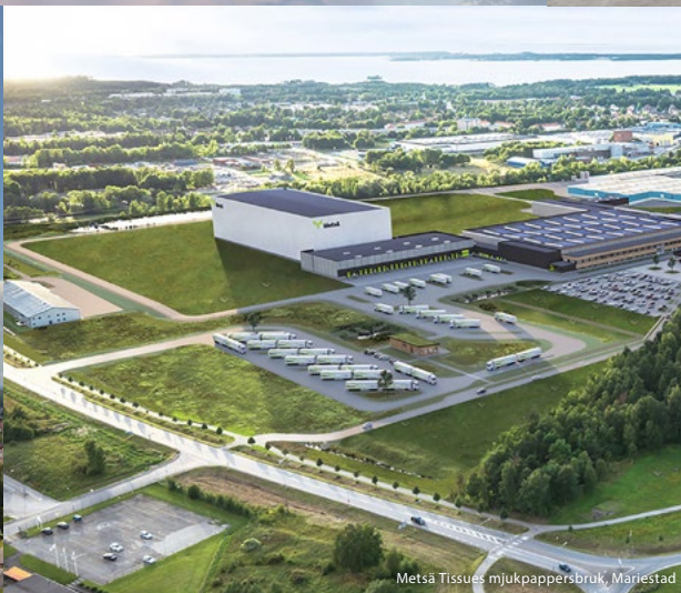
Metsä Tissues mjukkappersbruk, Mariestad