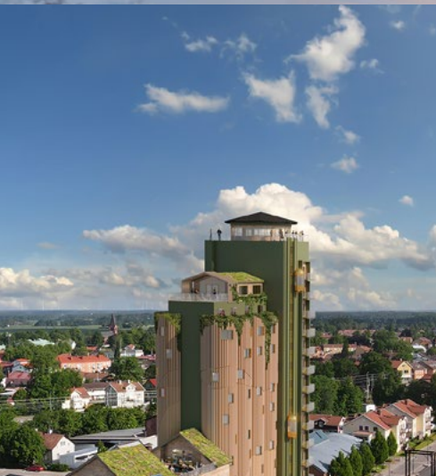
Green Tower, Töreboda