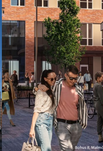
Bohus 8, Malmö